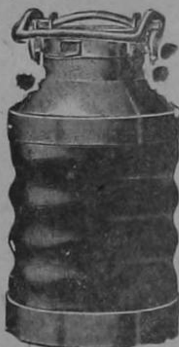
pinturas Al-bastin etc.

CEMENTO "Alsen"; clavos, alambre de cerca, arados varios modelos, cocinas de hierro para leña, lavatorios, inodoros, tanque alto y bajo, de Sarchí sillas, etc